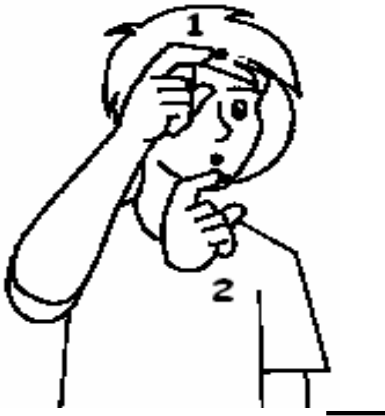
OU 30 MINUTOS